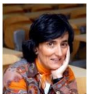
Loreto Corredoira | @loretoc

Periodista, anteriormente dirigió el programa "A vivir que son dos días" en Cadena SER. Ha desarrollado su carrera en diversos medios en España: Agencia EFE, Canal+, Tele 5 y Antena 3. Colabora habitualmente con el diario La Vanguardia .